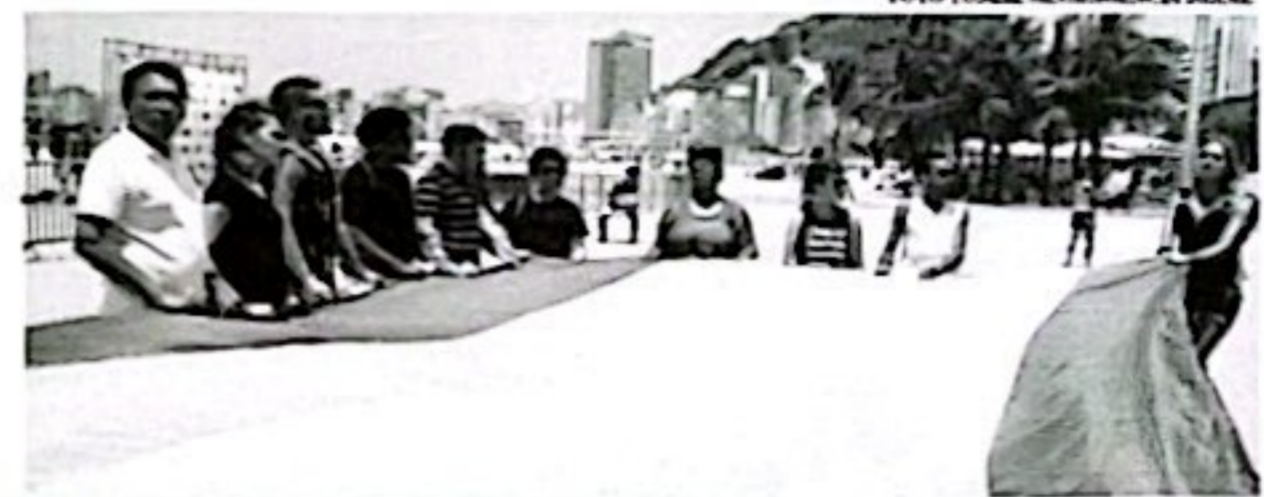
Brasil é em absoluto o país que mais mata mulheres trans no mundo

O documento também aponta que, no ranking geral em números absolutos de mortes por assassinato de mulheres trans, o Ceará aparece em 2º lugar, com 107 assassinatos. O estado